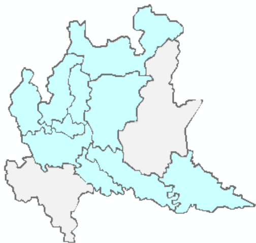
DOMANI domenica 28/04