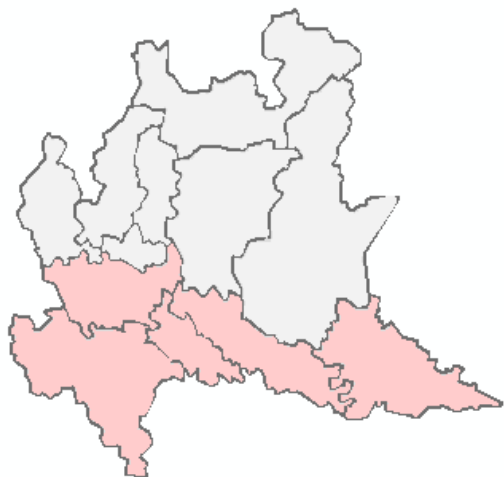
DOPODOMANI lunedì 29/04